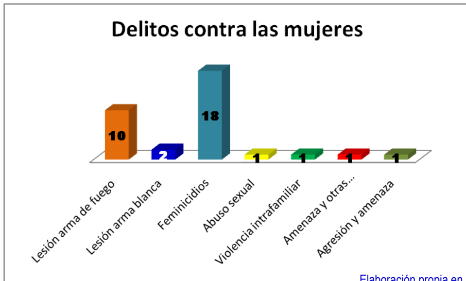
Elaboración propia en base a datos reportados por medios de prensa: LPG-EDH y Co Latino

En el mes de junio 34 mujeres fueron víctimas de diferentes delitos de violencia de género. 18 fueron asesinadas, diez fueron lesionadas con arma de fuego y dos con arma blanca, cuatro mujeres fueron víctimas de abuso sexual, violencia intrafamiliar, amenazas, agresión y amenazas respectivamente.